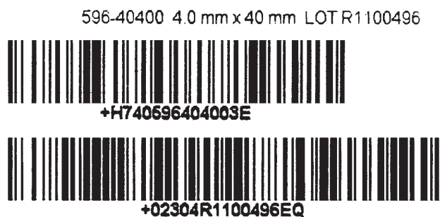
Figura 1. Codici primario e secondario secondo lo standard HIBC. Nel primo codice (codice primario) è possibile identificare il codice della ditta (H740) e il codice del prodotto (596-40400). Nel codice secondario l'anno e il giorno (304° giorno del 2002) e il numero di lotto (R1100496).

Il lettore Gryphon 100 è un lettore che divide con il computer la porta per la tastiera; non necessita dell'installazione di alcun software aggiuntivo e "mima" la digitazione manuale del codice (da ciò in emulazione tastiera), con affidabilità e velocità nettamente superiori. La profondità di campo va da una lettura a con-